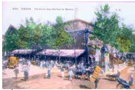
L'un des pavillons des Halles de Paris, au début du XX e siècle : un symbole de nouveaux modes de vie et d'une offre grandissante qui déconnecte de plus en plus la population de son potager.