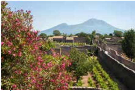
Encore aujourd'hui, dans l'ancienne ville de Pompéi (Italie), il subsiste quelque chose de l'atmosphère des potagers méditerranéens antiques.