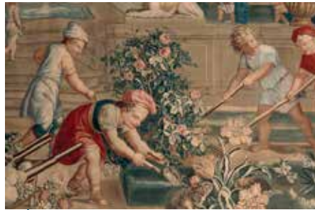
Cela fait longtemps que le jardin a développé un outillage qui peut être très spécialisé, comme cette pelle à couvercle destinée à répartir des graviers blancs décoratifs dans un bac à fleurs et représentée sur cette tapisserie des Enfants jardiniers (détails, XVII e siècle).