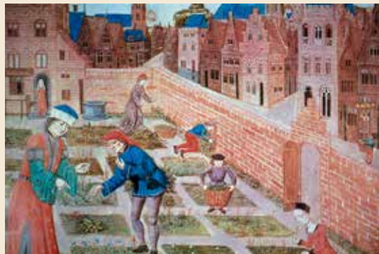
L'apothicaire fait procéder à la récolte des plantes médicinales. Dans ces jardins dits « de simples », les plantes officinales côtoyaient fréquemment les plantes condimentaires. On notera au passage la différence d'échelle entre les personnages et le jardin, dans cette enluminure du Roman de la Rose (v. 1400) : selon la pensée de l'époque, les Hommes sont à l'image de Dieu et ont pour mission de dominer la Nature.