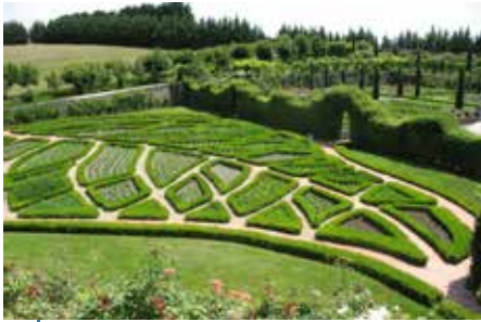
Le château de la Chatonnière (Indre-et-Loire), ou comment un potager contemporain peut s'inscrire spectaculairement dans un site historique.