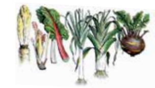
Illustration de légumes Détails de l'ouvrage de Corneille D'après M. Loret, La maison de l'homme de l'antiquité à nos jours à l'échelle des civilisations Page 46, page 47 Illustration par M. Loret, 1920 Prés des Editions, Les potagers, et sur d'autres, les jardins culturels.

On sait que les premiers jardins nourriciers furent créés lors de la domestication des plantes et animaux par l'homme, il y a plus de 10 000 ans, sous de nombreux latitudes et dans des régions du monde fort éloignées les unes des autres. Toutefois, on ne trouve que peu ou pas de traces de leur existence et la multiplicité des jardins qui ont existé chez des peuples sans relations physiques ou culturelles. Il est vraisemblable que certaines civilisations, au moins à l'Est et du continent américain, dont les Aztèques, aient eu depuis des millénaires des jardins de production.