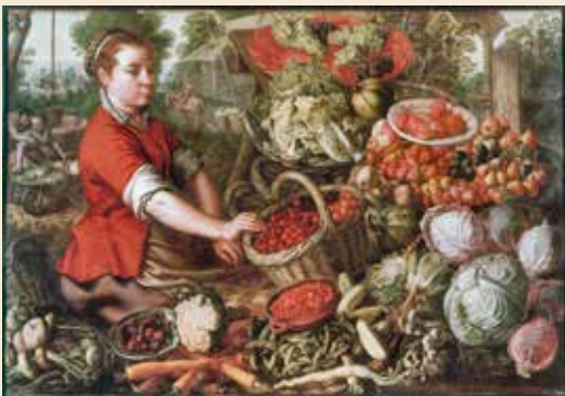
Dans La Pourvoyeuse de légumes , le peintre flamand J. Beuckelaer (XVI e siècle) a eu à cœur de montrer la diversité de production du potager tant en légumes qu'en fruits, même si l'association représentée est plus d'ordre esthétique que réaliste, tous ces végétaux ne se récoltant pas à la même saison.